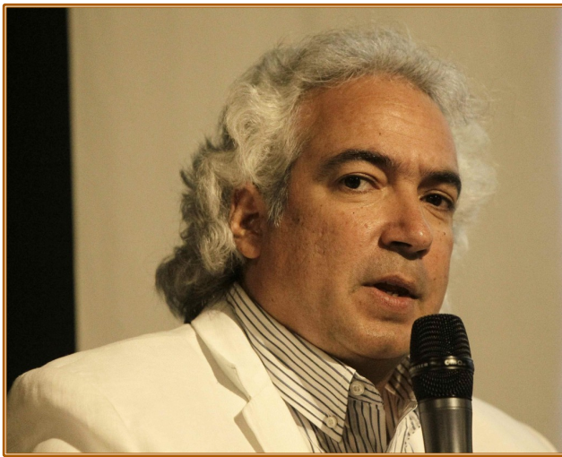
Former Minister of Culture of Costa Rica